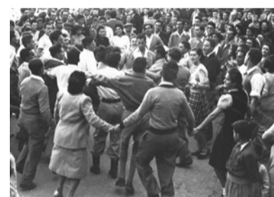
1947 הצבעה על תוכנית החלוקה היישוב היהודי בארץ ישראל פורץ בריקודים וחוגג את אישור תוכנית החלוקה באו"ם. תקום המדינה!