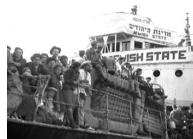
1947 אוניית "מדינת היהודים" 2,664 מעפילים שהפליגו מבולגריה הגיעו עד לפתח הארץ. הם נשלחו על ידי הבריטים למחנה ריכוז בקפריסין