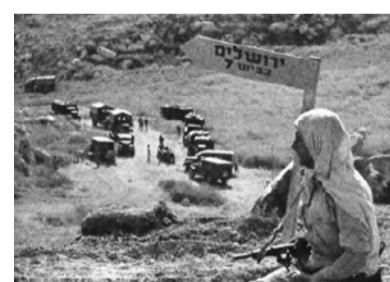
1947/8 המצור על ירושלים שלושה לוחמי גדוד פעלו לסלילתה של דרך בורמה מחולדה לירושלים כדי לפרוץ את המצור