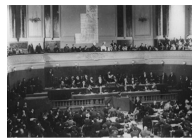
1897 הקונגרס הציוני הראשון ראשית צמיחת הציונות. הפיכת חזונו של בנימין זאב הרצל, "מדינת היהודים", למציאות